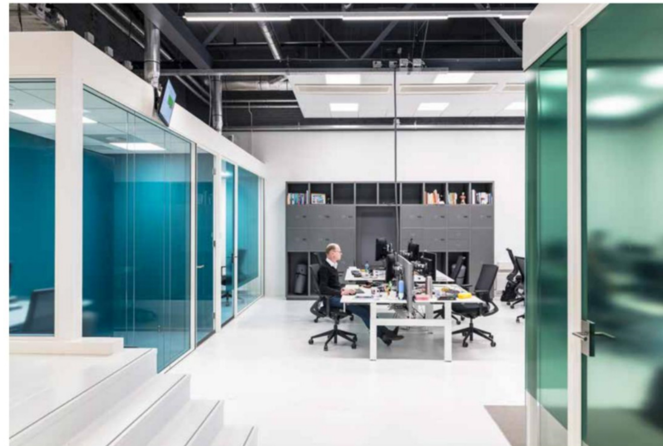
De teamworkzone stimuleert de onderlinge samenwerking