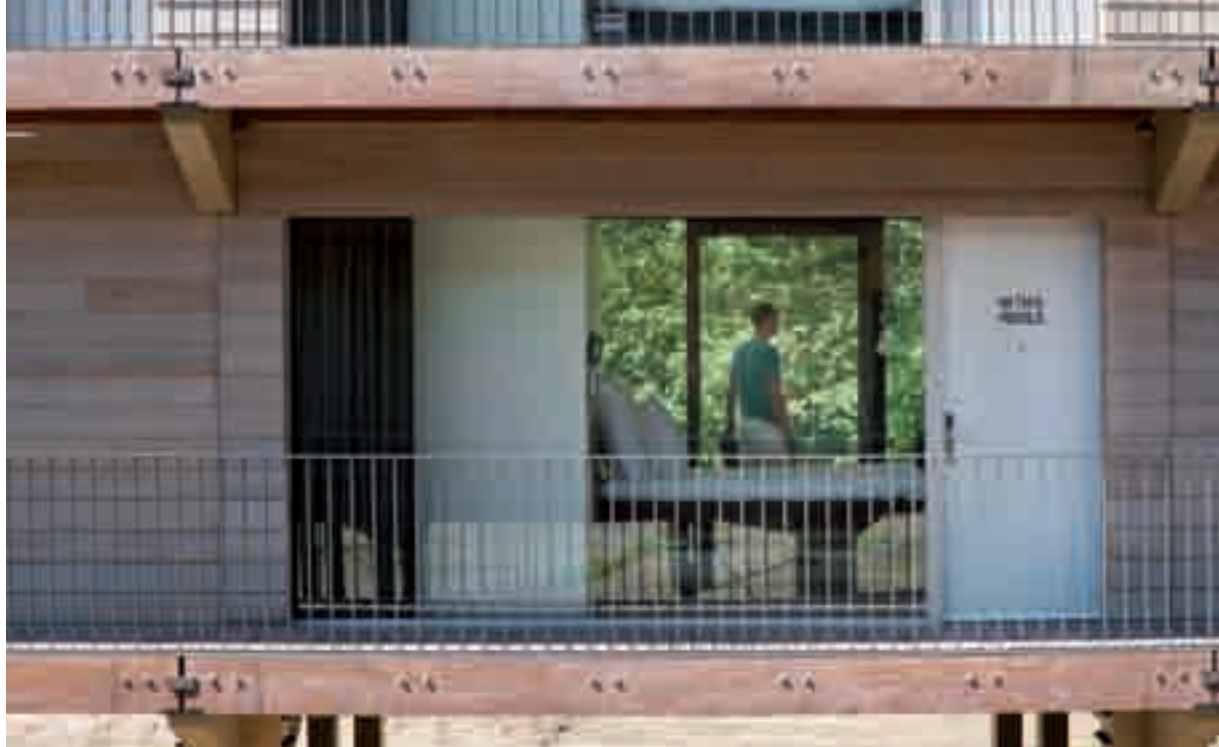
Bomen als buren.