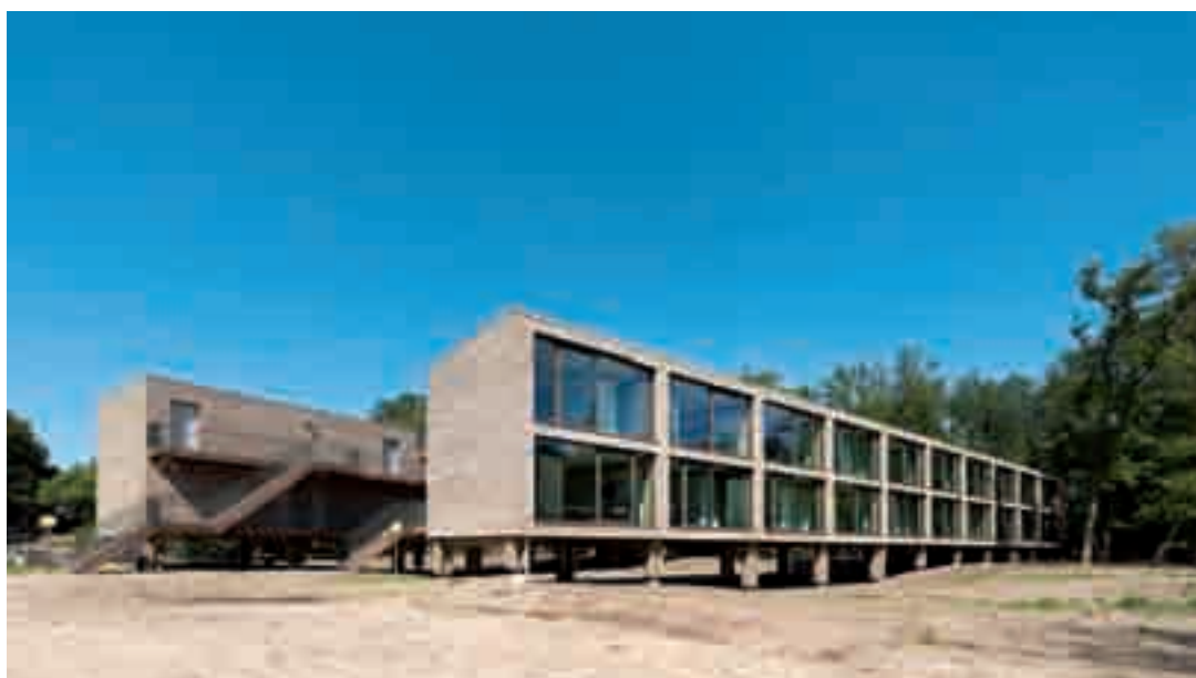
Gestileerde vorm van boshutten.