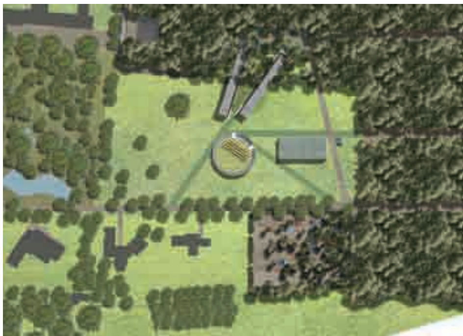
TEKENINGEN: OTH ARCHITECTEN AMSTERDAM