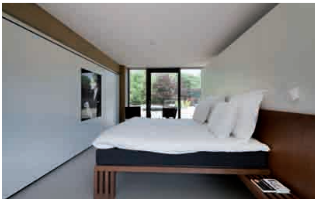
In de strakke interieurs zorgt de kunstverrijking voor de in- dividuele variatie.